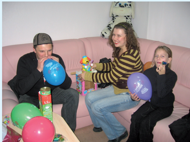
Дитячий центр місто Київ