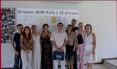
26 менеджерів Центрального Офісу та керівників регіональних відділень Мережі пройшли навчання на сертифікатній програмі із загального менеджменту, лідерства та роботи в команді та бізнес-етикету у Міжнародному Інституті Менеджменту;