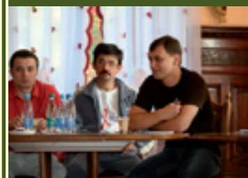
Special plenary meeting for ECUO representatives, Foros