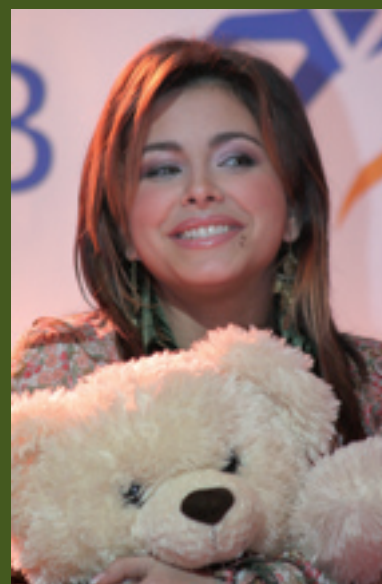
UKRAINIAN POP-STAR ANI LORAK AT THE CHARITY AUCTION "SIMPLY CHILDREN"