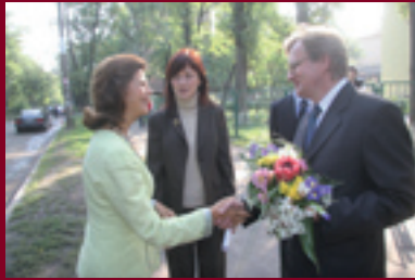
Візит Її Величності Королеви Швеції до Громадського центру