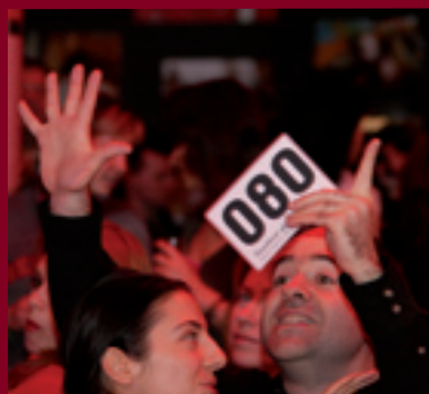
Перший благодійний аукціон «Просто діти»

Партнерами Мережі у проведенні цього заходу стали Міжнародний фонд «Відродження», Фонд Братів Кличків, розважальний комплекс «Arena Entertainment», Міжнародний благодійний фонд "Ейдос", Галерея «Софія-А», Цирк «Кобзов», спонсорами - Компанія «XXI століття» та мережа ресторанів «Козирна карта», газета «Без цензури» та канал «О-TV»