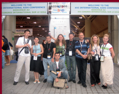
Участь представників Мережі у XVI Міжнародній конференції з ВІЛ/СНІД Торонто (Канада)

За активного сприяння Мережі втричі збільшено розмір коштів з державного бюджету України на зміцнення клінічної бази, закупівлі АРВ-препаратів, у тому числі для лікування ВІЛ-позитивних дітей, закупівлю препаратів для лікування опортуністичних інфекцій та гепатитів