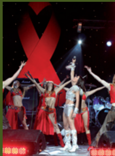
CHARITY CONCERT-MARATHON “LIVE !”