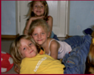
Дитячий центр місто Кривий Ріг

Групи самопомогі працюють у 44 містах: Полтава, Київ, Одеса, Любашівка, Луганськ, Львів, Хмельницький, Чернігів, Тернопіль, Суми, Чернівці, Херсон, Каховка, Павлоград, Тернівка, Дніпропетровськ, Сімферополь, Севастополь, Керч, Феодосія, Івано-Франківськ, Черкаси, Канів, Вінниця, Ужгород, Кіровоград, Кривий Ріг, Запоріжжя, Нікополь, Харків, Житомир, Бердичів, Мелітополь, Маріуполь, Слов'янськ, Костянтинівка, Волноваха, Горлівка, Донецьк, Краматорськ, Рівне, Орджонікідзе, Біла Церква, Кременчук.