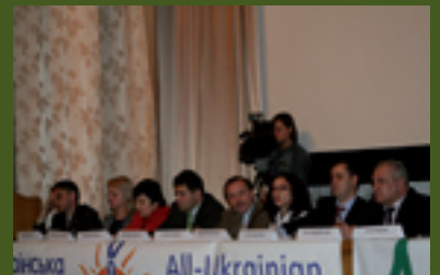
VIII National Conference of HIV-service organizations and positive people