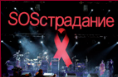
Благодійний концерт-марафон "Живи!"

1-го грудня 2006 року Всеукраїнська Мережа ЛЖВ провела заходи, присвячені Дню солідарності з ВІЛ-позитивними людьми у 46 містах України, що є рекордним показником для організації. З кожним роком все більше міст країни долучається до заходів, присвячених Дню порозуміння з ВІЛ-позитивними людьми.