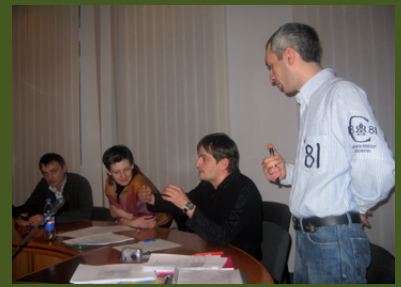
Meeting of the Regional Representatives Council, Chernihiv