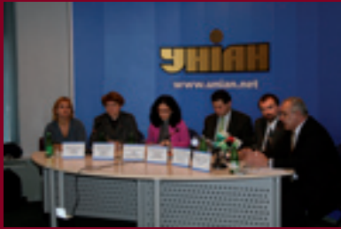
Пресс конференція 8 листопада 2006 року. Початок проекту: Підтримка профілактики ВІЛ СНІДу лікування та догляд для найуразливіших груп населення України.