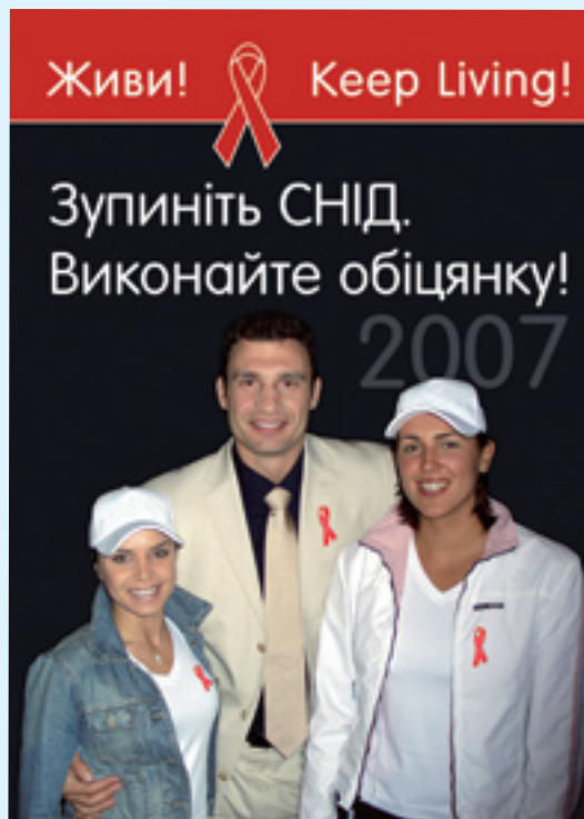
Плакат, присвячений Всесвітньому дню боротьби зі СНІД