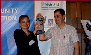
Мережа - переможець у номінації "Відповідь на стигму та дискримінацію, пов'язану з ВІЛ/СНІД"