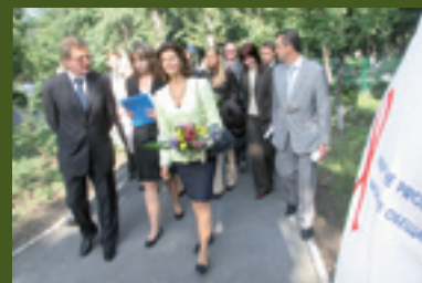
HER MAJESTY'S VISIT TO THE COMMUNITY CENTRE FOR HIV-POSITIVE CHILDREN

Pop stars Ani Lorak and Mariyka Burmaka performed for the guests of the auction. It was their personal contribution to combating HIV/AIDS in Ukraine.