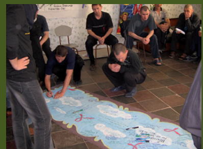
Group work in prison No 72 (Mykolayiv)

Self-help groups work in 44 cities: Poltava, Kyiv, Odesa, Lyubashivka, Luhansk, Lviv, Khmelnytskyi, Chernihiv, Ternopil, Sumy, Chernivtsi, Kherson, Kakhovka, Pavlohrad, Ternivka, Dnipropetrovsk, Simferopol, Sevastopol, Kerch, Feodosiya, Ivano-Frankivsk, Cherkasy, Kaniv, Vinnytsya, Uzhhorog, Kirovohrad, Kryvyi Rih, Zaporizhia, Nikopol, Kharkiv, Zhytomyr, Berdychiv, Melitopol, Mariupol, Sloviansk, Kostyantynivka, Volnovakha, Horlivka, Donetsk, Kramatorsk, Rivne, Ordzhonikidze, Bila Tserkva, Kremenchuk.