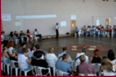
Четверта звітньо-виборча конференція Всеукраїнської Мережі ЛЖВ, 25-29 вересня 2006р. смт. Форос (Крим)