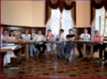
Зустріч представників Східноєвропейського та Центральноазіатського об'єднання ЛЖВ.