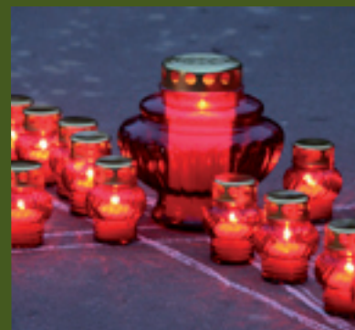
DECEMBER 1ST – SOLIDARITY DAY WITH HIV-POSITIVE PEOPLE

International festival of documentary films on human rights “Stalker” took place 15-17 December 2006 in Moscow. The Network’s representatives presented its activity in Ukraine and abroad, talked to journalists and public during press-conference. A well-known Russian journalist Volodymyr Pozner expressed his support to the Network and stressed that the activity of the Network should serve as an example in combating HIV/AIDS epidemic, stigma and discrimination