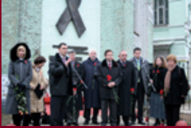
1 грудня – День солідарності з ВІЛ-позитивними людьми. Церемонія біля меморіалу "Червона стрічка", м. Київ