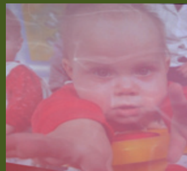
AUCTION "SIMPLY CHILDREN"