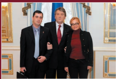
Віктор Ющенко, Президент України, Володимир Жовтяк, Голова Координаційної ради Всеукраїнської мережі ЛЖВ, Ірина Борушек, член Координаційної ради Всеукраїнської мережі ЛЖВ