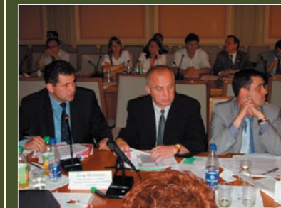
Establishment of partner relations with the government at the highest level