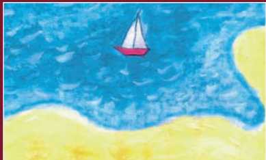
Саша, 3 роки, м. Донецьк