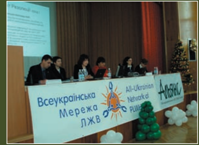
VII National Conference of HIV-services organizations and positive people

17 PR-managers of the Network got special educational trainings with the aim of improving professional qualification in 17 regions: Kyiv, Sumy, Cherkasy, Chernigiv, Kirovograd, Ivano-Frankivsk, Dnipropetrovsk, Chernivtsy, Poltava, Zaporizhzhya, Kharkiv, Lviv, Kherson, Mykolajiv, Vinnytsa, Khmelnytsky.