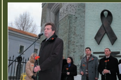
The ceremony near the Red Ribbon memorial on December 1st, 2005.