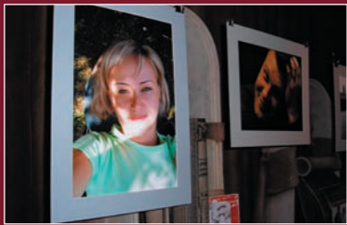
75 активістів Мережі ЛЖВ, які живуть з ВІЛ, відкрили свої обличчя всій країні шляхом участі в зйомках фільмів («Позитивні люди»), фотопроекті Віктора Суворова «Люди, які живуть з ВІЛ/СНІД», телепрограмах, коментарях для випусків новин тощо.

люди усвідомлюють необхідність і важливість таких кроків для подолання стигми та дискримінації по відношенню до хворих на ВІЛ/СНІД з боку суспільства.