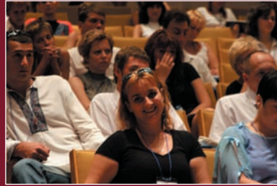
III Звітньо-виборча конференція Всеукраїнської Мережі ЛЖВ, 19 – 23 вересня 2005р. смт. Форос (Крим)

З метою підвищення професійної кваліфікації пройшли навчання 17 PR-менеджерів Мережі з Київської, Сумської, Черкаської, Чернігівської, Кіровоградської, Івано-Франківської, Дніпропетровської, Чернівецької, Полтавської, Запорізької, Харківської, Львівської, Херсонської, Миколаївської, Вінницької, Хмельницької областей.