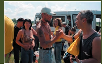
Therapeutic camp for PLWH in Poltava

90 PLWH received assistance in getting viral load blood test done.