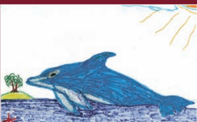
Вікторія, 8 років, м. Полтава