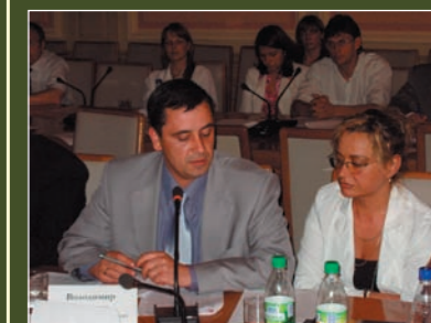
Representatives of the Network during the meeting in Verhovna Rada

Due to the Network's initiative, the State Department of Ukraine on Punishments Implementation and the Ministry of Health issued an edict #186/607 on 15 November 2005 on HAART provision in prisons.