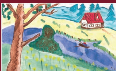
Артем, 6 років, м. Донецьк