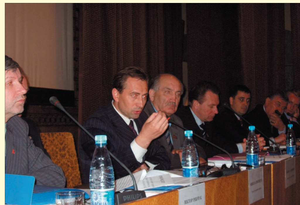
During presentation of a research "Social and economic prognosis of consequences of HIV/AIDS epidemic in Ukraine" April 29, 2005.