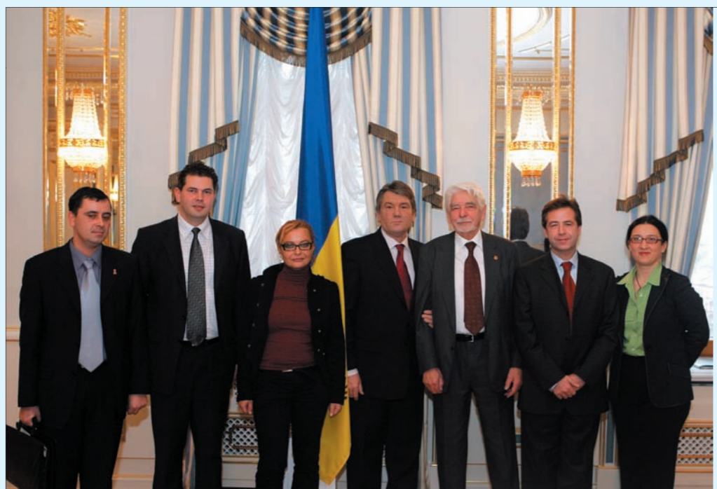
Учасники офіційної зустрічі Спеціального Посла Генерального секретаря ООН з питань ВІЛ/СНІД у Східній Європі Ларса Каллінгса та Президента України Віктора Ющенка.