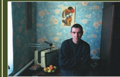
75 activists of the Network, living with HIV opened their faces to the broad masses. They took part in the film sessions ("Positive people"), Viktor Suvorov' photo project "People, Living with HIV/AIDS", different television programs, gave comments in their news sessions.

During 2005 year photojournalist Victor Suvorov continued his work upon the project "People Living with HIV". As the result of trips almost around all Ukraine, photos of 75 HIV-positive persons were made and their stories were noted down. A book "People Living with HIV" will consist from these photos and stories. In 2005 a previous photo-exhibition of Mr. Suvorov "168 hours" was displayed in Simferopol and Chernygiv.