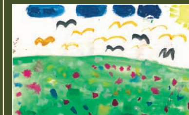
Zhenya, 8 years, Odessa