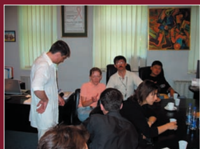
Зустріч зі підготовки створення Східноєвропейського Центральноазійського об'єднання організацій ЛЖВ

З ініціативи ВБО «Всеукраїнська Мережа ЛЖВ» Державний департамент України з питань виконання покарань та Міністерство охорони здоров'я України видали наказ за № 186/607 від 15.11.2005 року про впровадження ВААРТ у місцях позбавлення волі.