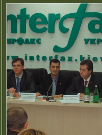
The head of coordination council - Volodimir Zhovtak, Minister of Health – Jurij Polachenko and Minister of Youth and Sport – Jurij Pavlenko during the press-conference devoted to the World AIDS Day