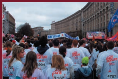
Пробіг заради життя