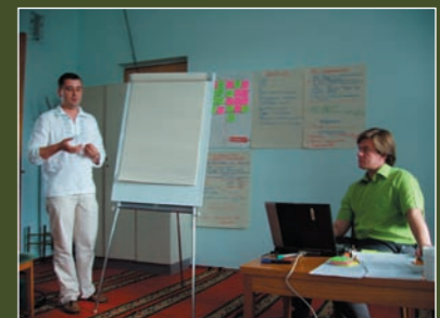
Social enterprising training