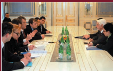
Учасники офіційної зустрічі Спеціального Посла Генерального секретаря ООН з питань ВІЛ/СНІД у Східній Європі Ларса Каллінгса та Президента України Віктора Ющенка.